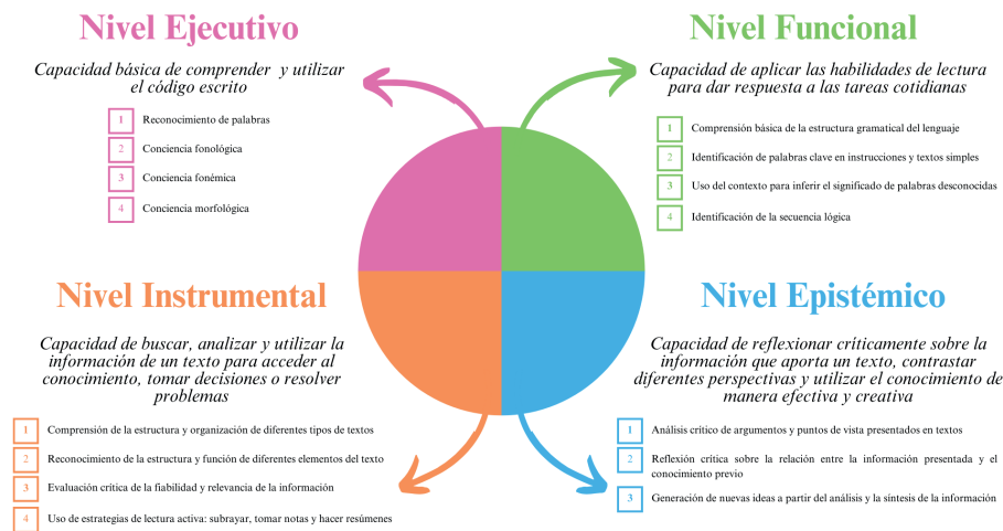
Fig. 1. Niveles y habilidades determinadas en la intervención