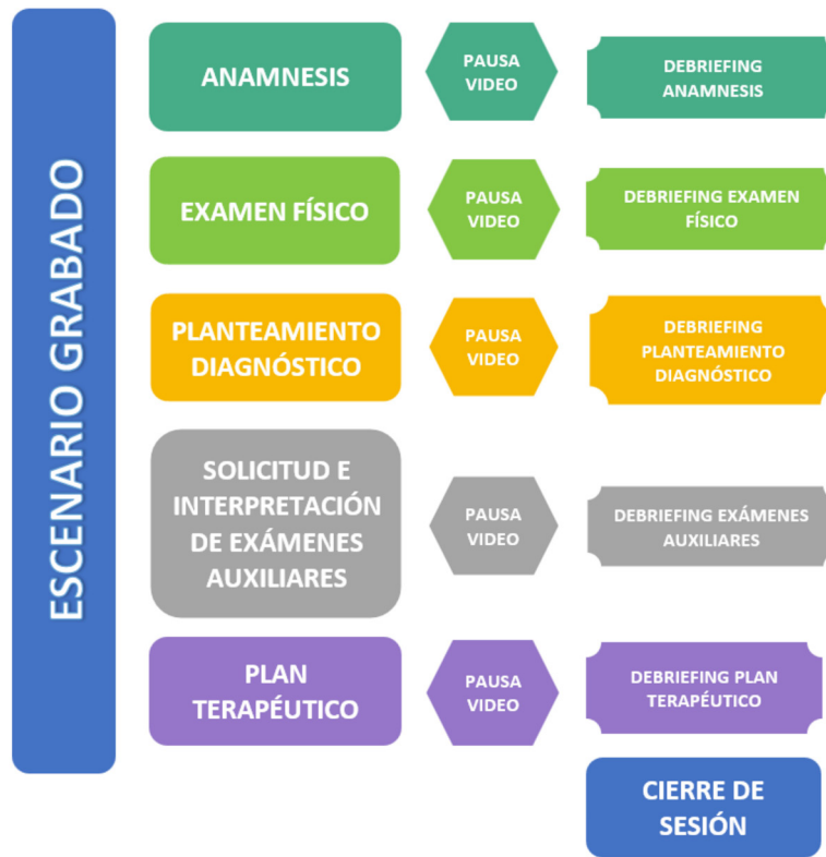
Figura 2. Pasos de la simulación clínica en escenario virtual