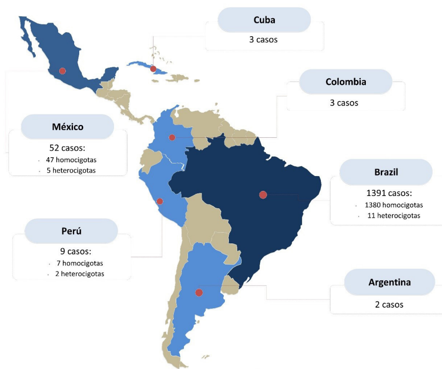
Figura 2. Distribución de casos reportados de ataxia de Friedreich en Latinoamérica