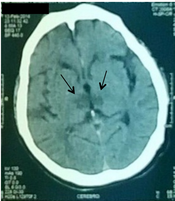
Figura 1. Tomografía computarizada cerebral sin contraste: las flechas en negro señalan la hipodensidad irregular en ambas regiones paramedianas del tálamo.

El día de su ingreso acudió a emergencia con un tiempo de enfermedad de una hora. Luego de una siesta vespertina súbitamente presentó cuadro confusional, con cefalea intensa seguida de coma, lo que requirió intubación endotraqueal al llegar a emergencia. Al examen inicial presentó hemiparesia izquierda, pupilas anisocóricas y signo de Babinski bilateral. La lectura radiológica inicial de la tomografía computarizada (TC) cerebral reportó: “hipodensidad en cerebelo derecho”, imagen en relación al infarto previo. A las 24 horas se realizó una angio-tomografía espiral multicorte cerebral cuyo informe radiológico describió una “hipodensidad tenue a nivel medial-anterior de ambos tálamos, sin malformaciones vasculares” (Figura 1). El nivel de conciencia del paciente fue mejorando hasta recuperarse por completo. Al cuarto día del ingreso obedecía órdenes muy simples, como abrir los ojos o mover las cuatro extremidades, se