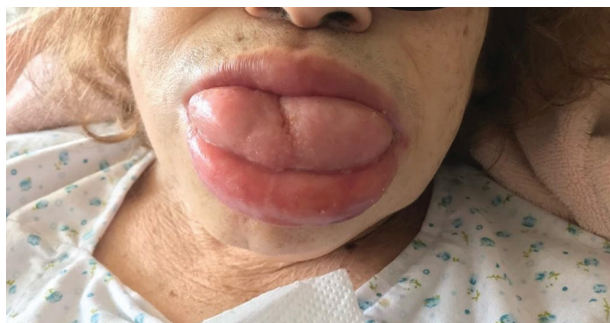
Figura 1. Macroglosia.

derecho con signo de flogosis; edema con fovea y dolor a la palpación en miembros inferiores. Se observaba una gran macroglosia (figura 1). El examen de tórax y pulmones y del sistema cardiovascular fue normal. El examen del sistema gastrointestinal era normal excepto por el tacto rectal que evidenció presencia de melena.