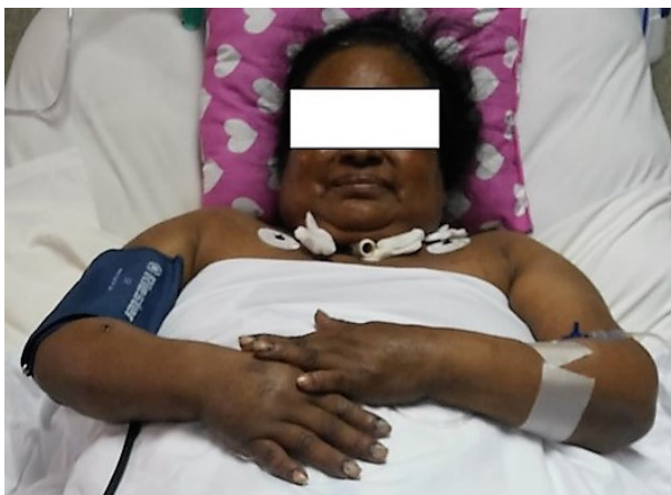
Figura 1. Hiperpigmentación cutánea, 7 días después de la administración de colistina.

Mujer de 50 años de edad, quien 6 meses antes del ingreso por Emergencia inició tratamiento