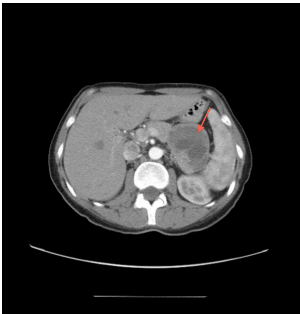
Figura 1. TAC abdominal: Tumoración de 7x6cm de diámetro, tabicada, con áreas de necrosis, que presentan una impronta hacia los vasos esplénicos

Tras obtener niveles de insulina y péptido C en el límite bajo de la normalidad repetimos el ayuno, obteniéndose resultados similares. El valor de proinsulina fue 20 pg/ml (<10). Después de demostrar la hipoglucemia se realizó un test de glucagon para glucosa, presentando valores basal y a los 10, 20 y 30 minutos de 36, 40, 49 y 52 mg/dl respectivamente. A pesar que los valores de insulina no sugerían claramente hiperinsulinismo, se realizó una TAC toracoabdominopélvica (Figura 1) en la que se observó una tumoración a nivel de la cabeza del páncreas de 7 x 6 cm de diámetro, tabicada, con áreas necróticas. Se decidió la intervención quirúrgica, realizándose pancreatectomía parcial, extirpando la tumoración a nivel de la cabeza del páncreas. El estudio histológico mostró células de pequeño tamaño dispuestas con patrón sólido y trabecular rodeando a abundantes vasos. La inmunohistoquímica mostró tinción positiva para cromogranina, sinaptofisina, CD56, proinsulina, con áreas positivas focales para Insulina y un Ki 67 del 10% (Figura 2). El diagnóstico definitivo fue tumoración neuroendocrina pancreática de tipo insulinoma.