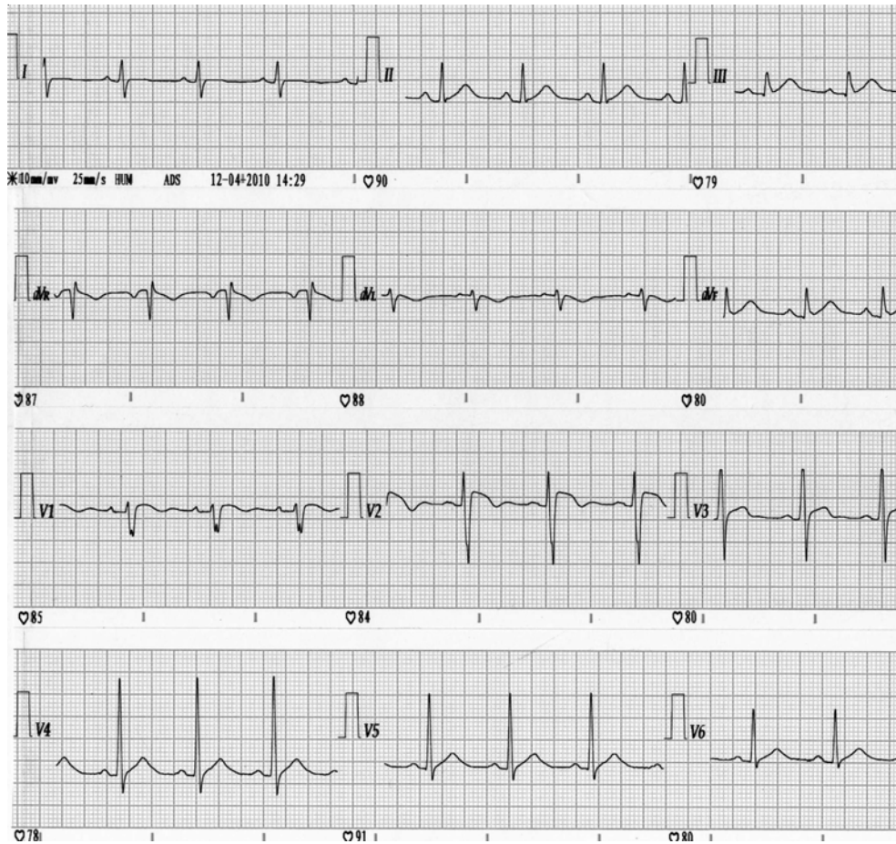
Figura N°1. Electrocardiograma basal. Presencia de cambios en la repolarización cardiaca con elevación del punto J en derivadas precordiales V1 y V2.

fibrilación ventricular, el síntoma inicial de presentación más frecuente (4).