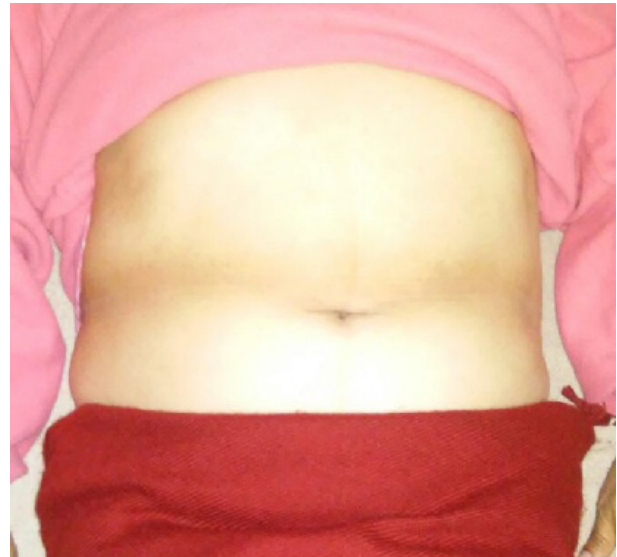
Figura 1. Localización del paciente en decúbito supino y con zona abdominal descubierta.

la apófisis xifoides; con el paciente en inspiración máxima se estira cada extremo del VNM en dirección a los bordes de las costillas hasta llegar por debajo de la altura del ombligo. La tensión del VNM aplicada en la primera sesión fue del 10% de la longitud total del vendaje, incrementándose progresivamente en cada aplicación hasta un máximo del 40% (figura 2). La