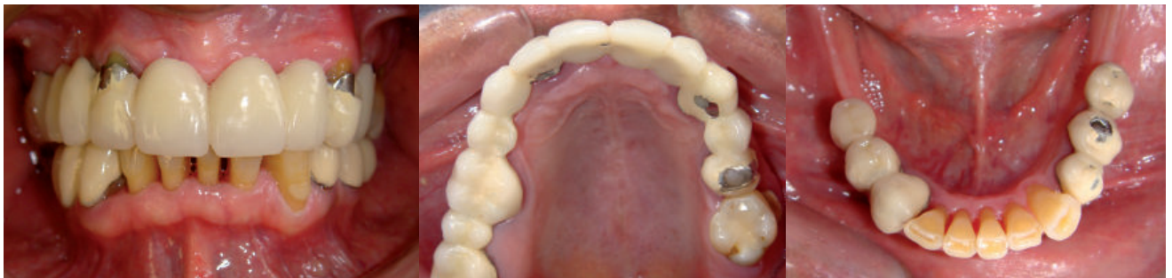
Figura 1. A. Maxima intercuspidadación, B. Vista Oclusal Superior y C. Vista Oclusal Inferior

Se procede al retiro de las prótesis fija y se toma una impresión funcional (se combinó silicona por adición de consistencia fluida para conseguir escurrimiento y mediana para que el producto final tenga densidad) para la confección de una placa base y rodete que nos servirá para determinar la dimensión vertical (evaluando el espacio disponible para la confección de la prótesis implanto soportada) así como también el soporte de los tejidos blandos (5) (Figura 3A, 3B y 3C).