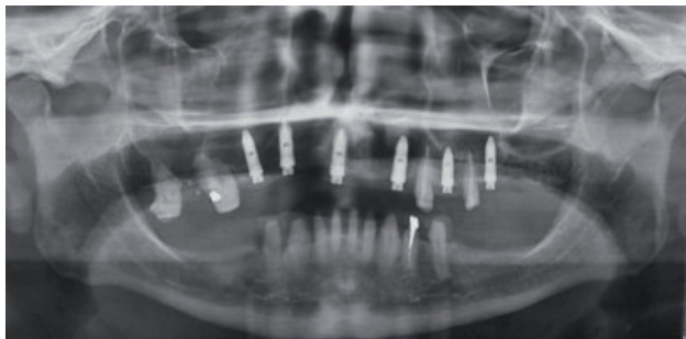
Figura 6. Radiografía panorámica final

Se procede a la cirugía teniendo como referencia la Guía Multifuncional (guía tomográfica confeccionada previamente) que ahora será nuestra guía quirúrgica. (Figuras 5A y 5B).