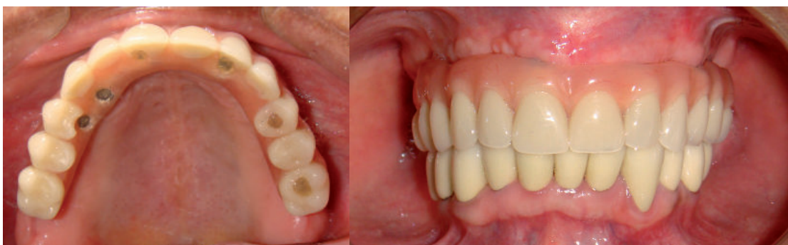
Figura 7A. Vista oclusal y B. Máxima intercuspidación.

Se seleccionaron los pilares y la profundidad del transmucoso con el probador de pilares, todos los pilares empleados fueron Mini Pilar CM Recto (Neodent) los cuales se ajustaron a 30N (según indicaciones del fabricante). Posteriormente se transfirió la ubicación de los pilares para lo cual se ferulizaron los aditamentos de transferencia con barras metálicas unidas con acrílico de combustión completa (alta estabilidad dimensional luego de la polimerización), se verifica que la cubeta individual confeccionada asiente adecuadamente, en caso la ferulización no permita un ingreso adecuado, se procede a desgastar la cubeta. Una vez tomada la impresión se colocan los análogos y alrededor de ellos silicona para simular la encía en el modelo.