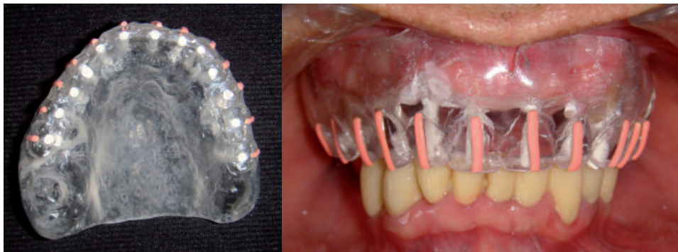
Figura 4. A. Guía multifuncional y B. Guía multifuncional en máxima intercuspidación

Una vez obtenida la imagen tomográfica (Tomografía Computarizada Cone Beam) se procede a realizar las mediciones en las zonas donde se van a colocar los implantes, dependiendo del programa utilizado.