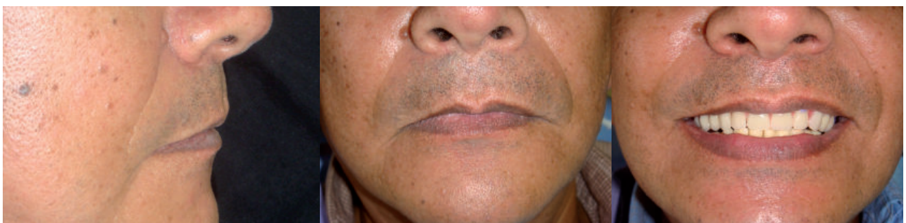
Figura 3. A. Soporte labial