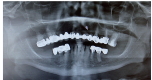
Figura 2. Radiografía panorámica inicial del paciente

Se duplica el encerado realizado para la confección de una guía tomográfica, en la cual se preparan ductos, los cuales son rellenos con gutapercha en barra, los cuales servirán como marcadores al momento del examen de imágenes, ubicando la probable posición en la cual se colocara el implante respectivo y a su vez con gutapercha rosada (conos de gutapercha empleados en endodoncia) en la zona vestibular para evaluar el contorno (Figuras 4A y 4B).