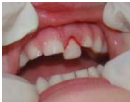
Fig. 4. Extrusión pieza. 61.