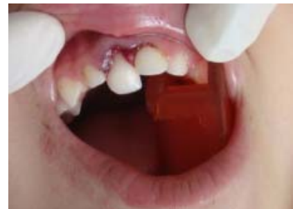
Fig. 1. Examen clínico de pza. 51 (Diagnóstico: luxación lateral y extrusión).