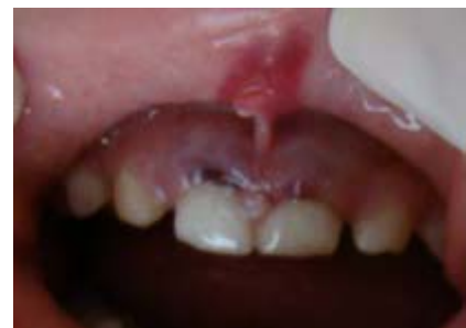
Fig. 3. Luxación Lateral de pzas. 51 y 61.