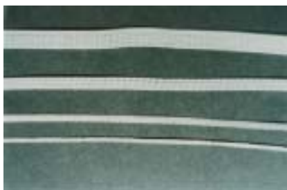
Fig. 6. Fibra de poliuretano Ribbond utilizada para fijar dientes luxados.