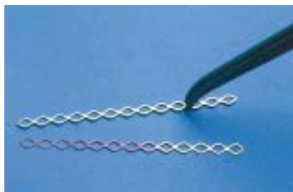
Fig. 7. Cadenas de Titanio (TTS ®), para fijar piezas dentales.