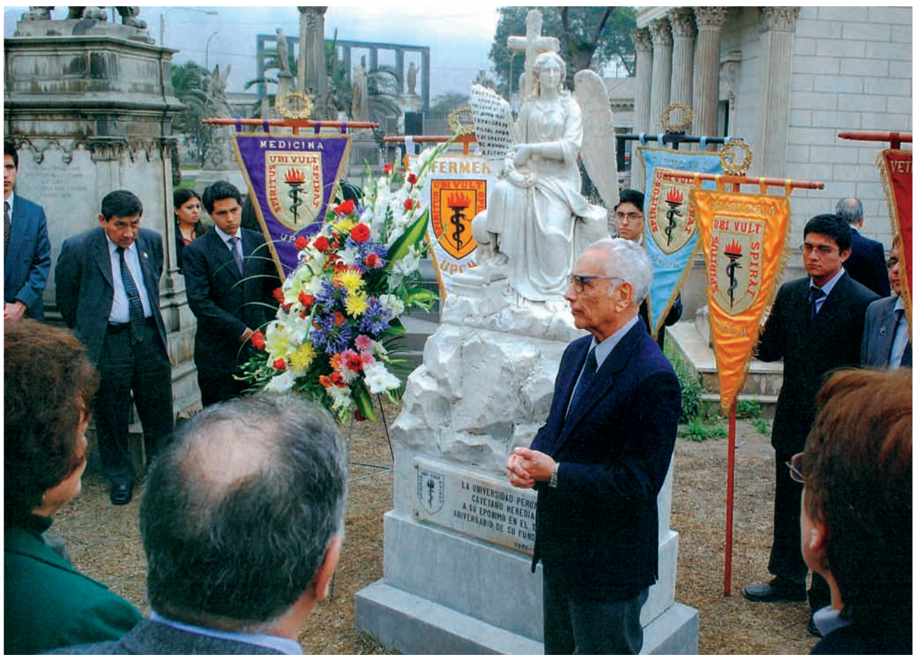
HOMENAJE DE LA UNIVERSIDAD PERUANA CAYETANO HEREDIA A SU EPÓNIMO EN EL XXV ANIVERSARIO DE LA FUNDACIÓN DE LA UNIVERSIDAD