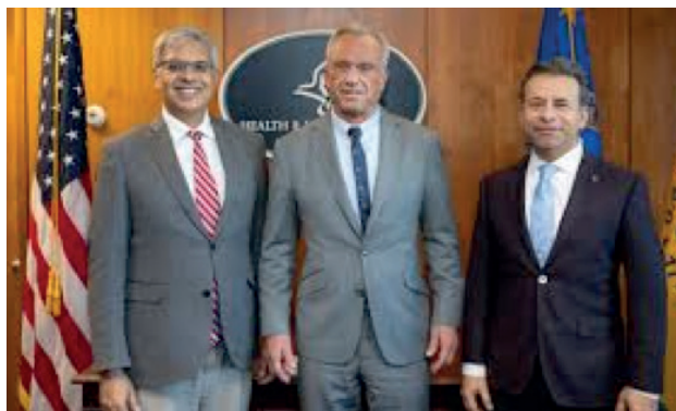
Jay Bhattacharya (nuevo director de los NIH), Robert F. Kennedy Jr (nuevo secretario de Salud y Servicios Sociales) y Marty Makary (nuevo comisionado de la FDA).

El anuncio más reciente, que causó zozobra entre científicos de países de ingresos bajos y medios (PIBM) que forman parte de redes de investigación vinculadas a universidades de EE. UU., se refiere a que se suspenderán los subawards (subcontratos académicos) que estas universidades celebran con sus contrapartes en aquellos países. Esta medida se sustenta en que los NIH no tienen forma segura de rastrear cómo se utilizan los fondos. Se ha informado que, luego de una revisión, serán reconvertidos en grants directos y tampoco se tocarán los grants directos que existen actualmente.