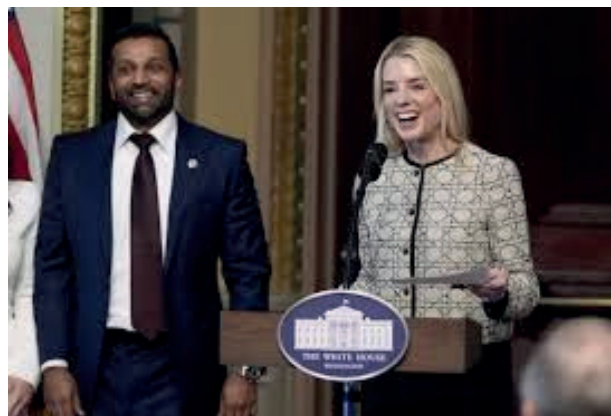
Kash Patel y Pam Bondi.

También se anunció la publicación de la información completa sobre el caso Jeffrey Epstein, magnate pedófilo que supuestamente se suicidó en prisión (Halpert, 2025). Debido a su vínculo con numerosos miembros de la élite mundial que lo visitaban en su isla del Caribe y que viajaba en el Lolita Express, las solicitudes para que se desista de la publicación de este informe han sido muy persistentes.