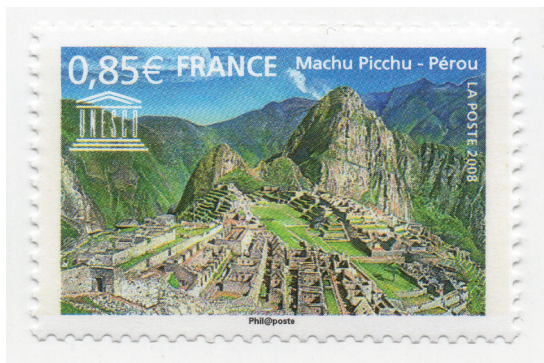
Figura 15. (Francia, 2008).

Este destino, con su aura mística y paisajes imponentes, deja una impresión duradera en quienes tienen el privilegio de explorarlo, convirtiendo el viaje a Machu Picchu en una experiencia inolvidable y también protagonista de diversas emisiones postales alrededor del mundo.