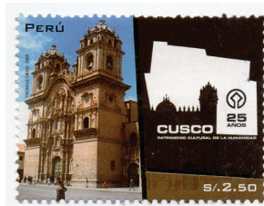
Figura 2. (Perú, 2009).

La ciudad del Cusco fue el centro del universo para los incas, ombligo del mundo, ya que en ella convergían todos los rincones del Imperio. Actualmente, Cusco exhibe una singular convivencia de edificaciones de la época inca, española y moderna, donde sus habitantes pasean aún ataviados con sus trajes típicos.