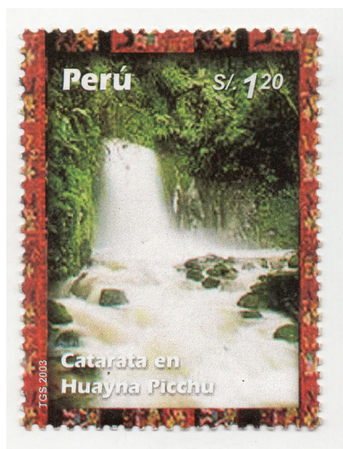
Figura 11. (Perú, 2004).

Intihuatana, o ‘Piedra del Sol’, es un punto focal en Machu Picchu. Se cree que esta piedra tallada estaba vinculada a eventos astronómicos y ceremonias espirituales.