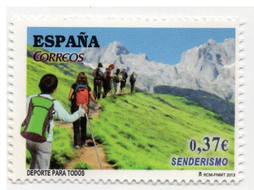
Figura 6. (España, 2013).

Aquellos que recorrieron los Caminos del Inca son recompensados con la visión de la ciudadela al amanecer. Sin embargo, si eligieron la opción más práctica de llegar por tren, pueden esperar al día siguiente para recibir al sol en la ciudadela perdida de los incas. Hoy es reconocida por la Unesco como Patrimonio Mundial de la Humanidad (Unesco, s. f.). En cualquier caso, la experiencia alcanza su punto máximo cuando los viajeros llegan finalmente a Machu Picchu.