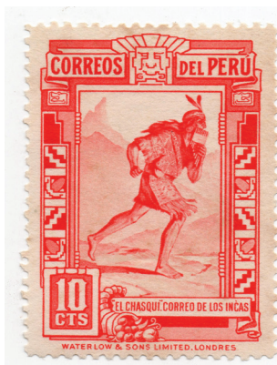
Figura 4. (Perú, 1936).