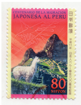
Figura 16. (Japón, 1999).

Este destino, con su aura mística y paisajes imponentes, deja una impresión duradera en quienes tienen el privilegio de explorarlo, convirtiendo el viaje a Machu Picchu en una experiencia inolvidable y también protagonista de diversas emisiones postales alrededor del mundo.