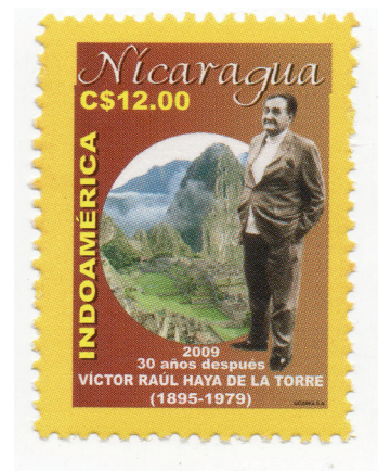
Figura 18. (Japón, 1999).