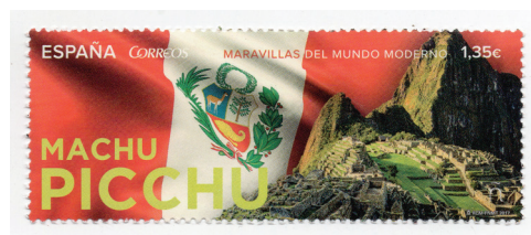
Figura 14. (España, 2017).

Los visitantes también son animados a respetar las reglas y contribuir a la preservación de Machu Picchu para que las generaciones futuras puedan disfrutar de esta maravilla del mundo.