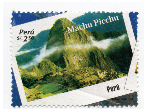
Figura 13. (Perú, 2007).

Con el aumento del turismo, surge la responsabilidad de preservar este tesoro arqueológico; por ello, se han implementado medidas para limitar el impacto ambiental y cultural, promoviendo prácticas de turismo sostenible.