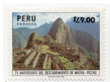
Figura 7. (Perú, 1987).

Las primeras luces del día iluminan gradualmente las imponentes estructuras de piedra, revelando la majestuosidad de Machu Picchu en todo su esplendor. El Valle Sagrado se extiende a sus pies y las montañas circundantes crean un telón de fondo impresionante.