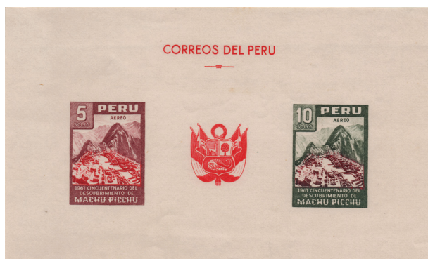
Figura 1. (Perú, 1961).

DOI: https://doi.org/10.20453/ah.v67i1.5278