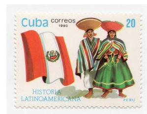
Figura 3. (Cuba, 1990).

Desde aquí, los viajeros tienen dos opciones: embarcarse en tren hasta el pueblo de Aguas Calientes, también llamado Machu Picchu Pueblo, o recorrer los épicos Caminos del Inca, una caminata de cuatro días en que se serpenteará por antiguos senderos, cruzando bosques nubosos hasta alcanzar las cumbres montañosas impresionantes y espectaculares, dándonos a conocer las vistas panorámicas del mundo andino como en la época de los incas antes de llegar a Machu Picchu.