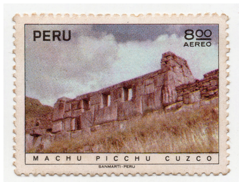
Figura 8. (Perú, 1972).

Una vez dentro de Machu Picchu, cada paso revela nuevos misterios y maravillas. Por ejemplo, en el Templo de las Tres Ventanas, los primeros rayos de sol entran en alineación con las ventanas trapezoidales finamente talladas, dejando pasar la luz de la mañana y proyectándola sobre el altar contiguo, emulando la leyenda de los hermanos Ayar (Astete y Bastante, 2020).