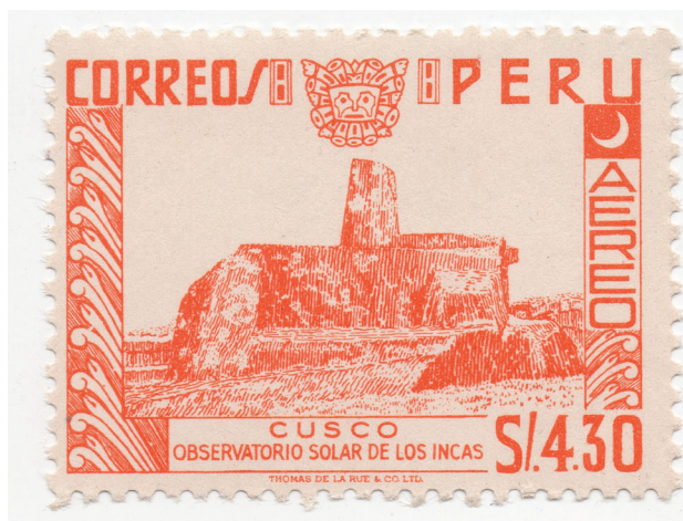
Figura 12. (Perú, 1962).

Intihuatana, o ‘Piedra del Sol’, es un punto focal en Machu Picchu. Se cree que esta piedra tallada estaba vinculada a eventos astronómicos y ceremonias espirituales.