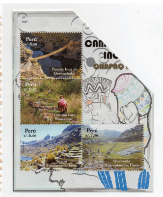
Figura 5. (Perú, 2009).