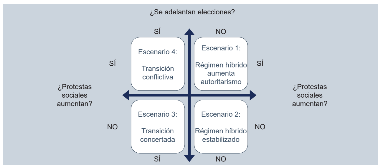
Gráfico 2. Escenarios probables de salida a la crisis política.

Relacionando ambas variables tenemos cuatro escenarios representados en el siguiente gráfico: